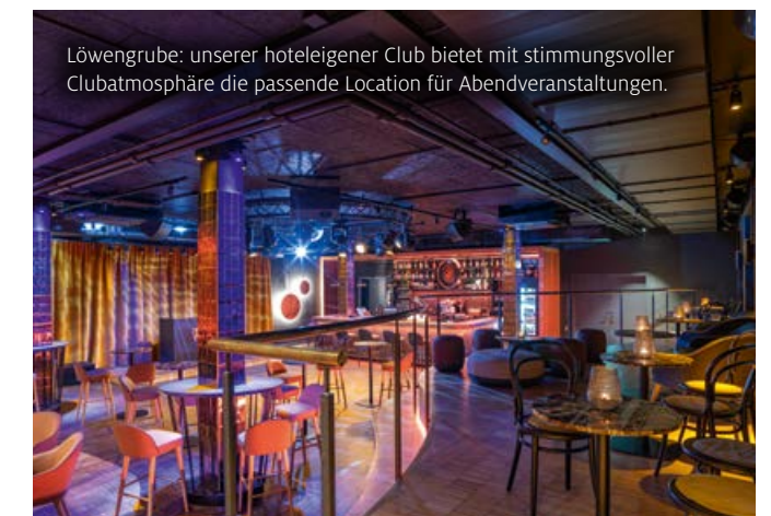
Löwengrube: unserer hoteleigener Club bietet mit stimmungsvoller Clubatmosphäre die passende Location für Abendveranstaltungen.