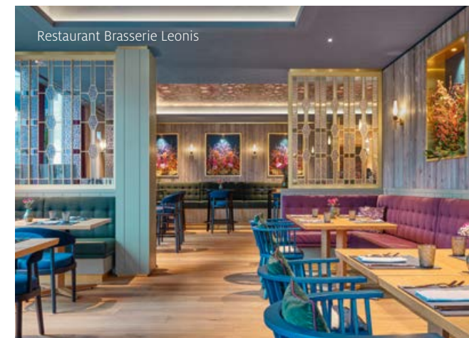
Restaurant Brasserie Leonis

Erleben Sie kulinarische Genüsse mit atemberaubendem Blick auf die Montafoner Bergwelt und lassen Sie sich mit erstklassigen Gerichten verwöhnen, im Anschluss lädt die Löwen Bar zum perfekten Ausklang des Abends ein.