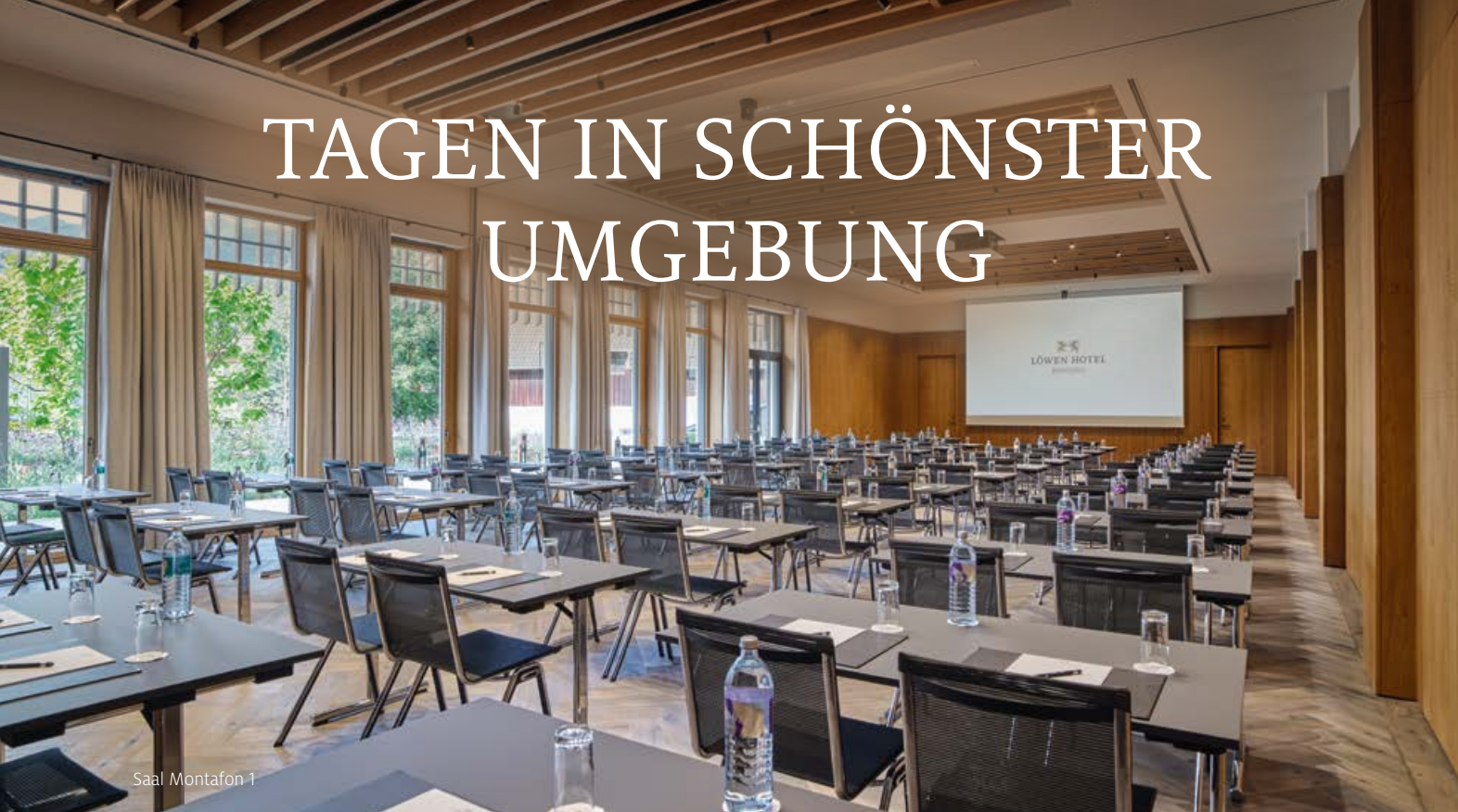
Saal Montafon 1

Moderne Architektur und ein stimmungsvolles Interieur-Konzept tragen zum Erfolg Ihrer Veranstaltung mit persönlicher Konferenzbetreuung und individueller Raumgestaltung bei. Vom weitläufigen Konferenzsaal mit Foyer für Empfänge bis zum VIP-Meeting mit eindrucksvollem Blick auf die Montafoner Bergwelt ist hier alles umsetzbar.